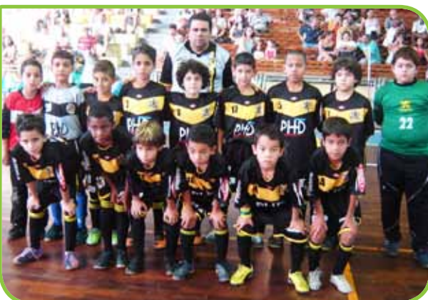
Categoria Sub-09 venceu todos os jogos e está com 100% de aproveitamento

Por sua vez, a categoria Sub-17 perdeu uma partida (para o AABB, por 7 a 3), empatou duas (contra o Osasco, por 1 a 1, e contra o São Paulo, por 5 a 5) e venceu as demais: Ribeirão Pires, por 4 a 1; Salto, por 11 a 5; e Mercedes, por 5 a 4.