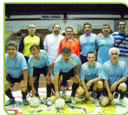
Cento e quinze atletas disputam competição

Iniciado no dia 25 de setembro, o 8º Campeonato Aberto de Futsal reúne 115 atletas, nas categorias Veterano (34 a 43 anos) e Veteraníssimo (44 a 49 anos). As partidas são disputadas às terças e quintas-feiras, no período da noite. Mais informações no site www.associacaoclube.com.br .