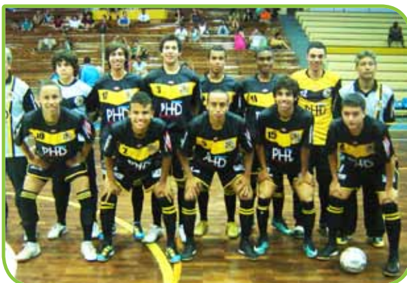
Atletas da Sub-17 perderam apenas uma partida no campeonato

As equipes da Associação vêm se destacando no Campeonato Estadual de Futsal Menores – Série Ouro, organizado pela Federação Paulista de Futebol de Salão. A invicta Sub-9, com 100% de aproveitamento, venceu todos os jogos: contra o São Paulo, por 4 a 3; Osasco, por 4 a 2; Ribeirão Pires, por 6 a 0; Salto, por 4 a 3; Mercedes, por 5 a 3; e AABB, por 6 a 1.