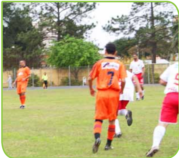
Equipes se destacam no fim do primeiro turno

O primeiro turno do 13º Campeonato Aberto de Futebol terminou e algumas equipes já aparecem