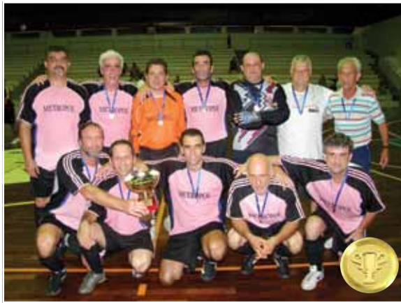
Metropol Campeão Master