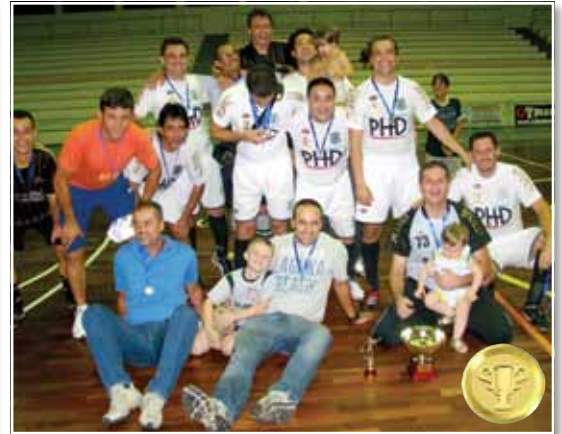
Planet Society Campeão Veterano